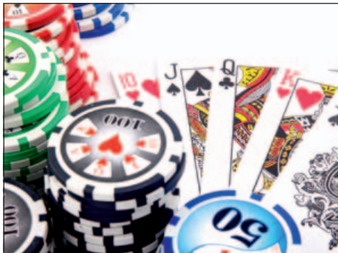
Bitte nicht noch mehr Spielhallen in Schwabach. Das fordert die SPD in einem Antrag.

Die Zahl der Spielhallen hat sich in Bayern binnen zehn Jahren mehr als verdoppelt – das ist die höchste Steigerungsrate unter allen Bundesländern! Auch in Schwabach ist die Zahl der Spielstätten explodiert. Sie metastasieren vom nördlichen Stadteingang bis zum südlichen Ende des Stadtgebiets. Freilich wenden manche ein, es habe ja auch früher schon eine Vielzahl von Glücksspielautomaten in Gaststätten gegeben, in Wahrheit handele es sich bloß um eine räumliche Konzentration. Die Wahrheit aber ist: Die Qualität des Glücksspiels hat sich völlig verändert. Durch manchmal schicke äußerliche Gestaltung und eine ansprechende Innenarchitektur wird das Glücksspiel in einen völlig neuen sozialen Kontext gestellt, und es wird von der unterhaltsamen Begleiterscheinung eines Wirtshausbesuchs zur Hauptsache.