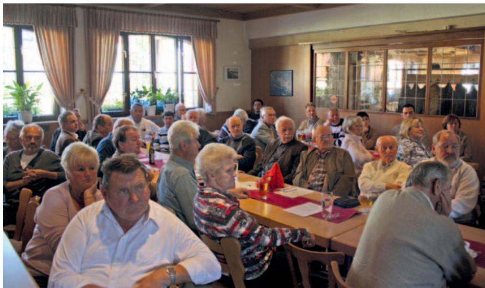
Die Diskussion mit Günter Gloser über die Eurokrise interessierte so viele Besucher, dass beim SPD-Frühshoppen kein Platz mehr frei blieb.

Staatsminister a.D. Günter Gloser diskutiert mit Schwabacher Bürgern